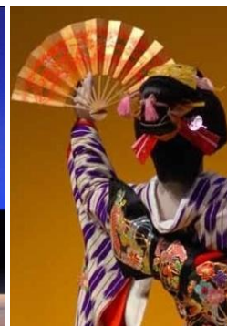
Imagem 3 – Nihon buyo