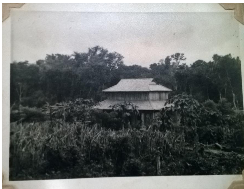
Foto 5 – Primeira casa no Brasil, s/d.

De primeiro momento não tinha casa, nós mesmos, a família que construímos uma, cortamos a madeira e fizemos. Usávamos madeira, bambu, folhas de coqueiro, e nós mesmos fizemos a casa. E aí por volta de três anos moramos lá. Depois disso, que fizemos uma casa mais bem feita, com madeira certa, com o teto mais bem feito, com outros materiais, depois de três anos. [...]Eu, até 1966, morei nesse local [colônia] do Matsubara. Aí em 1966 eu me casei, então eu comprei o terreno aqui e comecei a morar aqui 41 (TANIGUCHI, 2015).