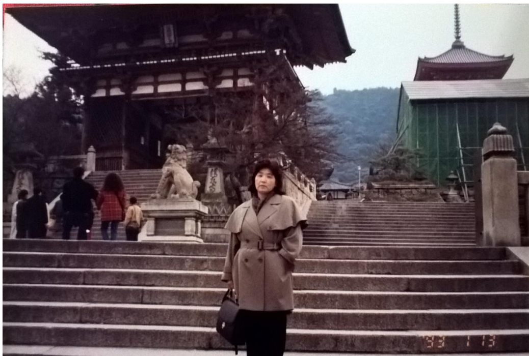
Foto 14 – Passeio em Osaka (Japão), 1993.

Percebe-se, então, que o Japão vivido na década de 1940 já não é mais o mesmo de agora e as experiências no Brasil possibilitaram a construção de outros pontos de vista sobre os mesmos valores. O habitus constituído, entre os princípios ocidentais de igualdade e liberdade foram (re)significados, em termos japoneses no Brasil, reforçando a lealdade e dedicação do ser membro de um grupo (no trabalho, na escola, na vizinhança), aceitando as características pessoais dentro dos limites das relações. Além disso, o relaxamento das regras habituais trazidos do Japão, praticados não tão rigidamente no Brasil, possibilitou aos japoneses desenvolver o que Wouters (2009, p. 111) chama de autocontrole no “descontrole controlado”. Para o autor,