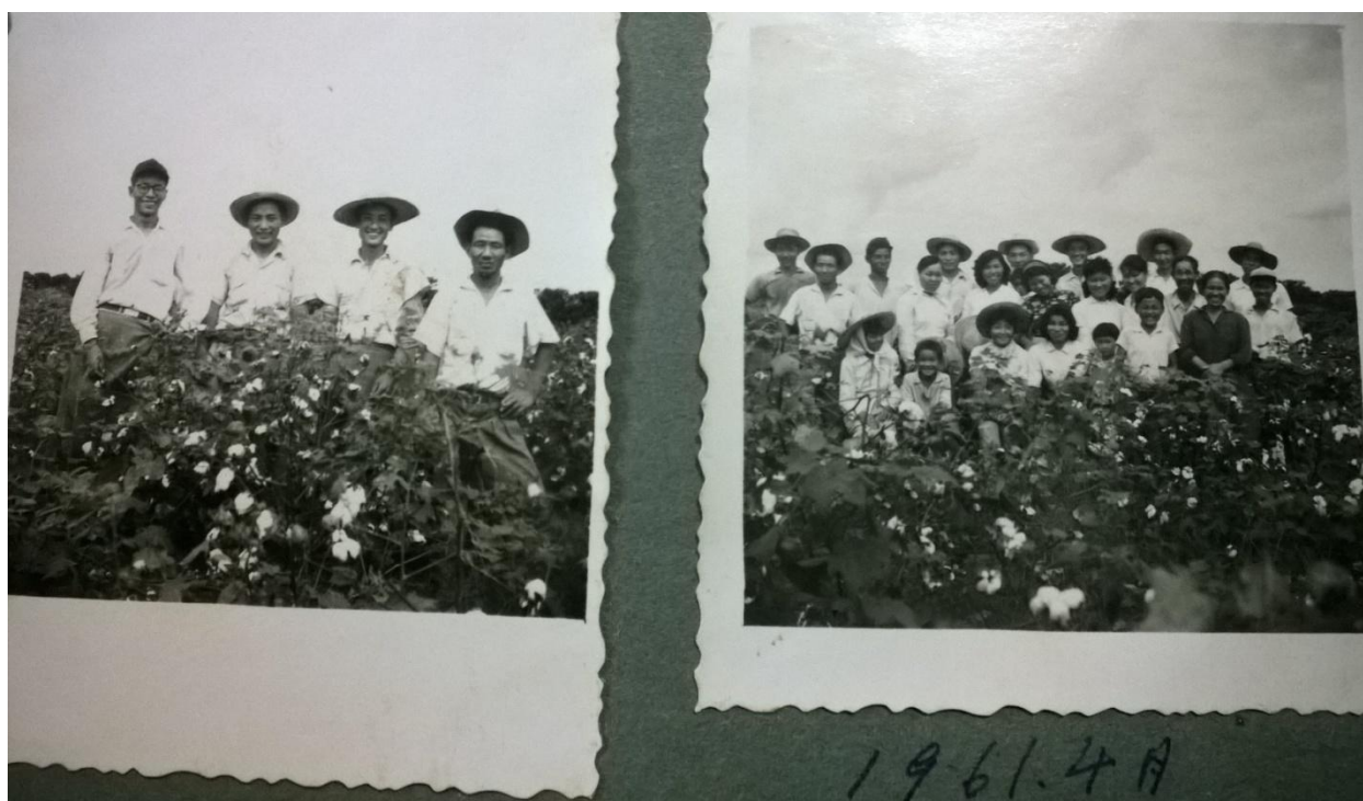
Foto 7 – Jovens da colônia Matsubara na lavoura de algodão, 1961.