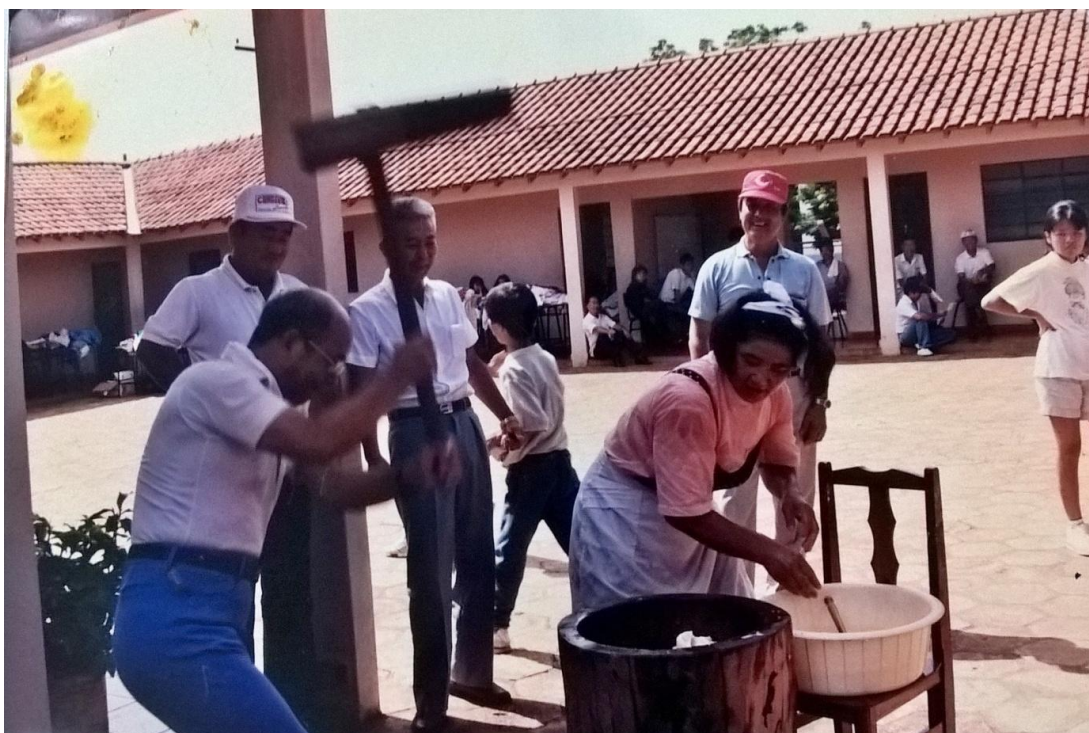
Foto 13 – Preparo do mochi (bolinho de massa de arroz), s/d.