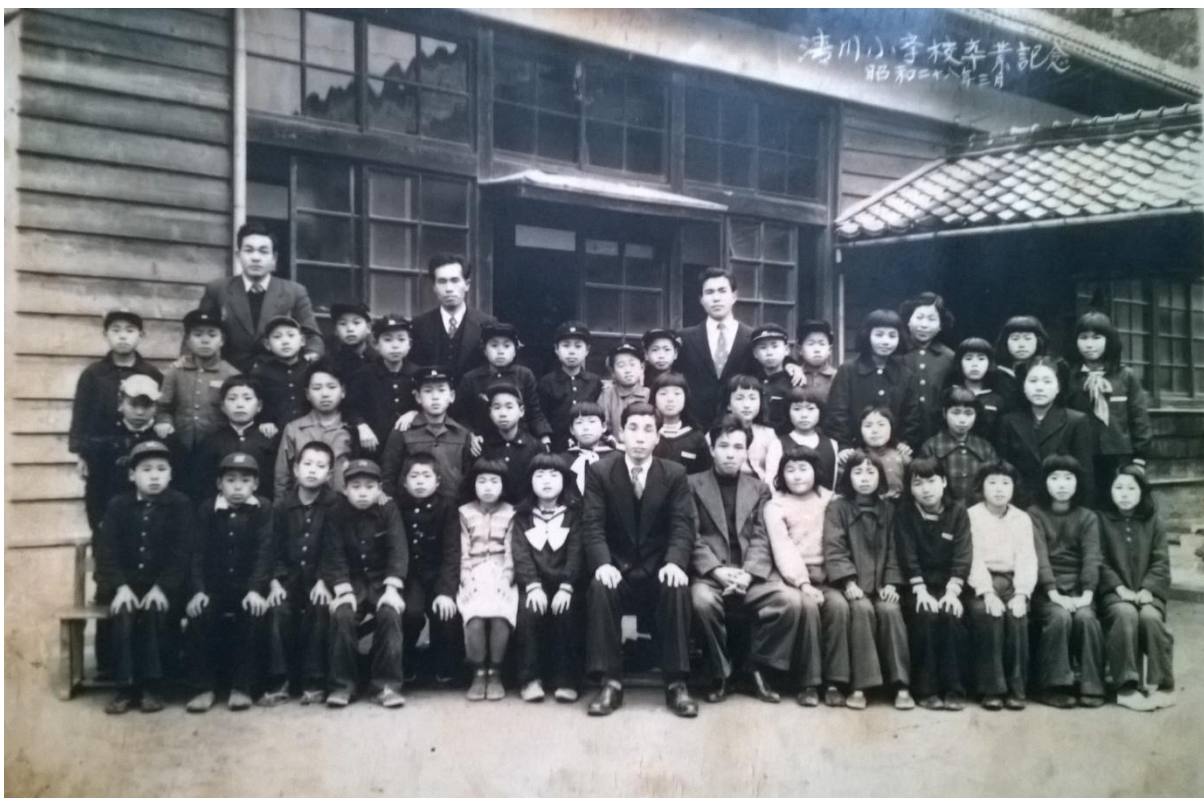
Foto 3 – Alunos e professores da escola de Taniguchi, foto comemorativa de formatura do Shogakko , ano 28 da era Showa (1953).

peças por classe... duas classes, portanto, umas trinta e poucas peças eu acho... também, éramos pequenos... (TERUI, 2015).