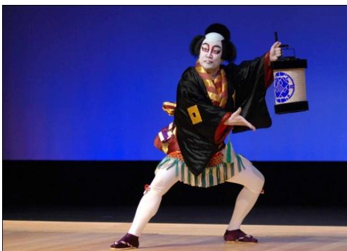
Imagem 2 – Kabuki