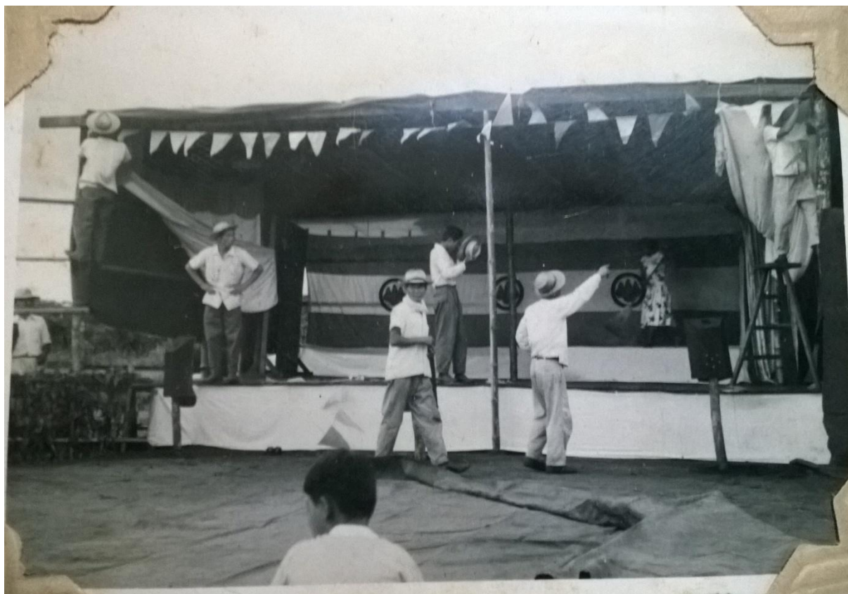
Foto 11 – Terceiro ano da imigração japonesa, palco comemorativo, s/d.

Em geral, essas associações fazem eleições todo ano, aí se escolhe um presidente geral sul-mato-grossense. Clube de Dourados, Kyoiei Barrerão, Laranja Lima, Fátima do Sul, Glória, no momento são 13 no total. Participo de tudo. Recebo vários convites e quando tem reunião eu também vou. [...]bem no começo, a gente participava, na época do meu pai, agora o presidente que é responsável é da segunda ou terceira geração (TANIGUCHI, 2015).