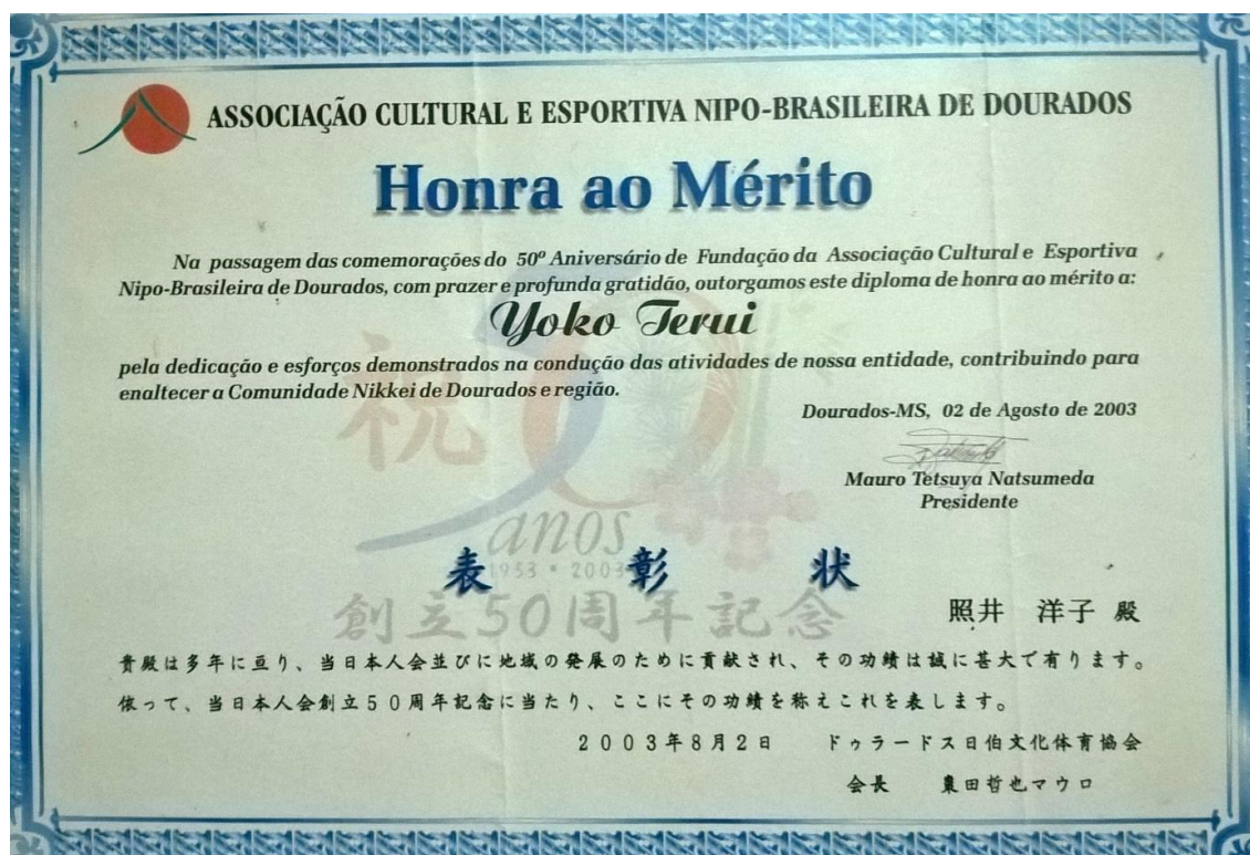
Foto 12 – Certificado Honra ao Mérito, como professora de dança japonesa em Dourados-MS, 2003.

Então, é que quando eu cheguei aqui eles perguntaram se eu dançava [risos] [...] então, já tem mais de 50 anos que eu venho ensinando (TERUI, 2015).