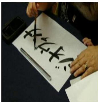
Imagem 1 – Shodo