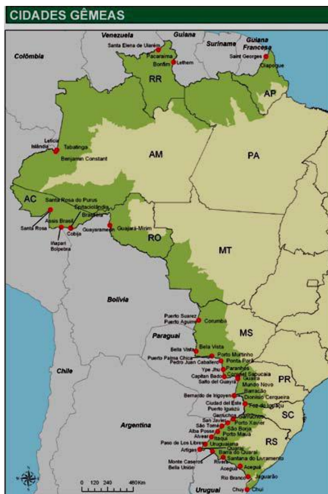
Mapa 2: Localização das cidades-gêmeas ao longo da Faixa de Fronteira