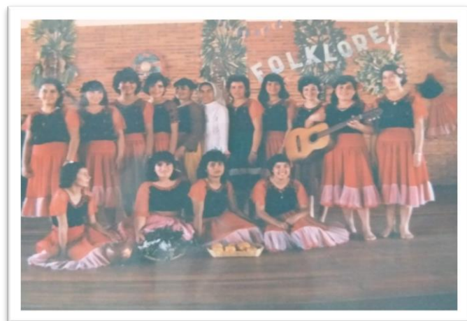
Imagem 4: Professoras de Pedro Juan Caballero preparadas para uma apresentação sobre o “Folklore”