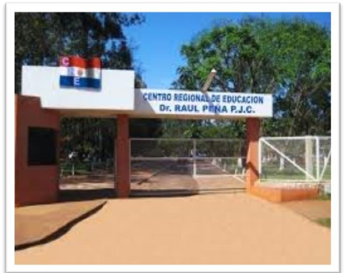
Imagem 2: Centro Regional de Educación Dr. Raul Peña – Pedro Juan Caballero