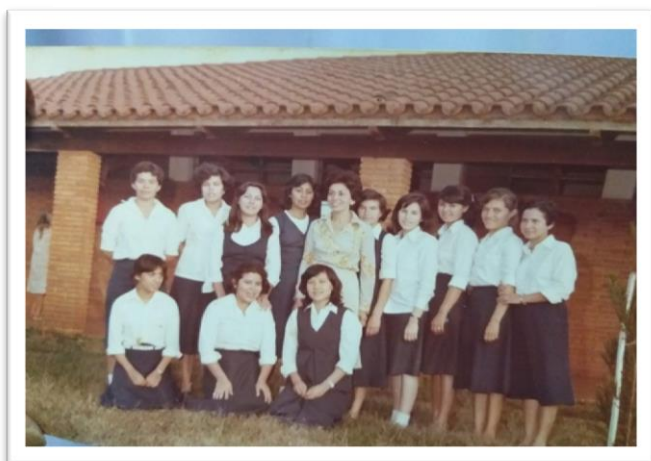
Imagem 3: Professoras de Pedro Juan Caballero no Centro Regional de Educación