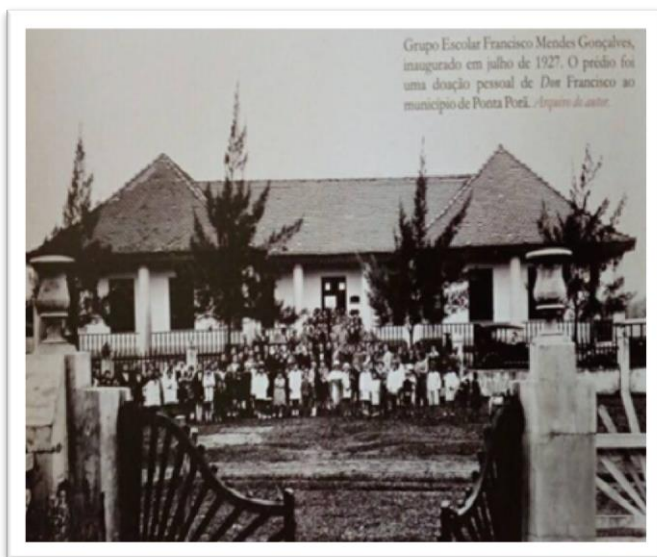
Imagem 1: Grupo Escolar Francisco Mendes Gonçalves - Ponta Porã