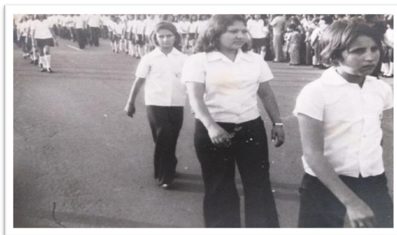
Imagem 5: Professoras de Ponta Porã participando de um Desfile Cívico