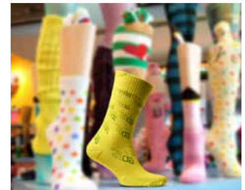
Meias Amarelas Cano Médio