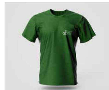
Camiseta Verde Manga Curta