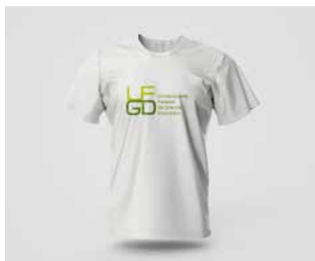
Camiseta Branca Manga Curta