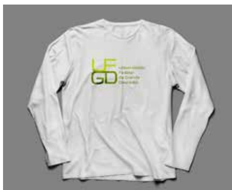
Camiseta Branca Manga Longa