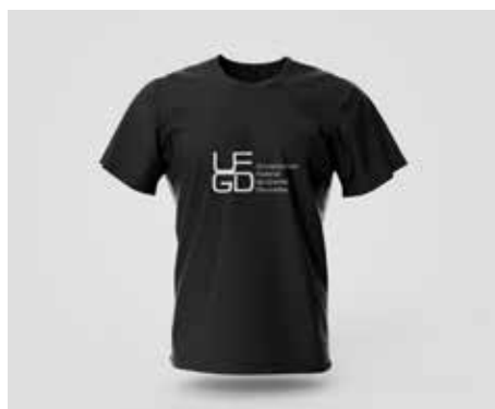
Camiseta Preta Manga Curta