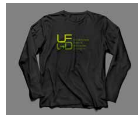
Camiseta Preta Manga Longa