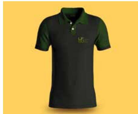
Camisa Pólo Cinza com Verde