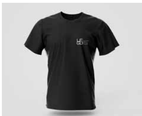
Camiseta Preta Manga Curta