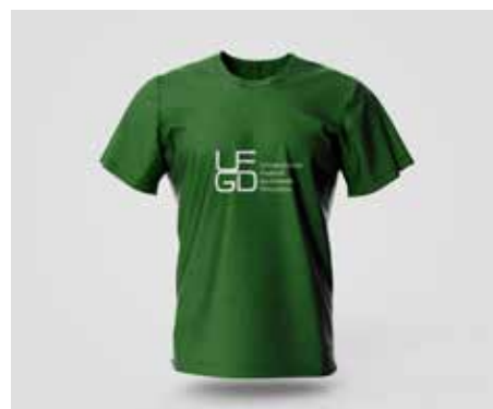
Camiseta Verde Manga Curta