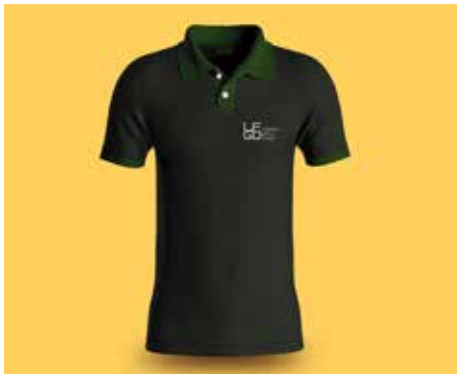
Camisa Pólo Cinza com Verde