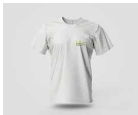
Camiseta Branca Manga Curta