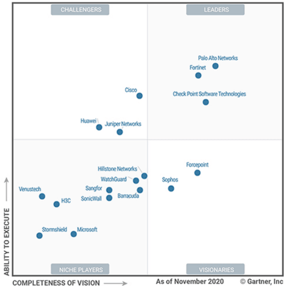
Figure 1. Magic Quadrant for Network Firewalls

tecnologia dentro de 4 quadrantes: líderes, desafiantes, visionários e competidores de nicho. Os fabricantes Palo Alto, Fortinet, Checkpoint são os líderes do Quadrante Mágico do Gartner Group e a Sonicwall é posicionada como um competidor de nicho, como pode ser observado na Figura abaixo: