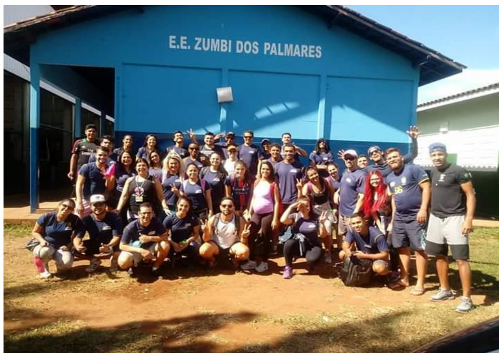
Figura 02: Visita à escola nas Furnas do Dionizio (Estágio 5º semestre)

Ressalto que tais atividades são importantes porém deve se tomar os cuidados já mencionados aqui, como por exemplo tais atividades não passem de apenas “currículos turísticos” e não reproduzir a transformação ou o aprendizado necessário para o fortalecimento da consciência transitiva crítica ou na manutenção da consciência ingênua e intransitiva.