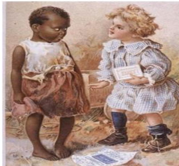
Figura 01: Sabão Fairy (Preconceito Racial) - 1900

O sabão americano que rendeu diversas polêmicas com suas propagandas racistas no começo do século passado apresentou esta campanha usando duas crianças: “Por que sua mãe não o lava com sabão Fairy?”.