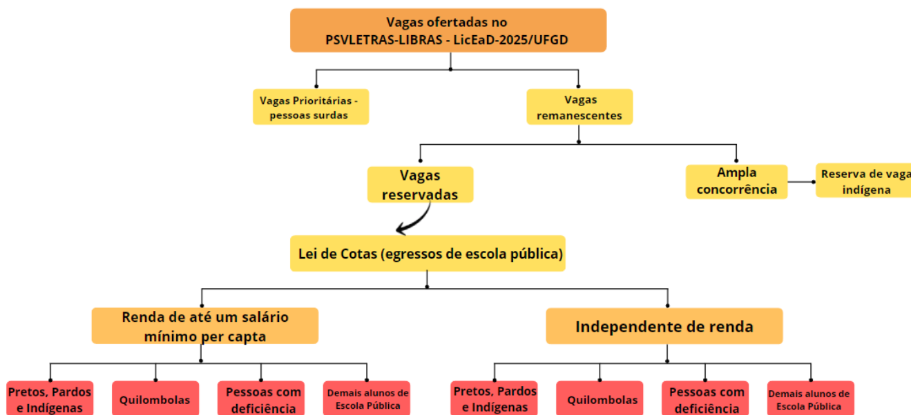
Diagrama 4 (Edital de Retificação CCS n.º 03/2024)

4.8. O candidato deverá escolher a faixa de renda per capita em que se enquadra, selecionar sua cor/raça, informar caso se enquadre, nos termos da lei, como PcD, e ainda indicar se é quilombola.