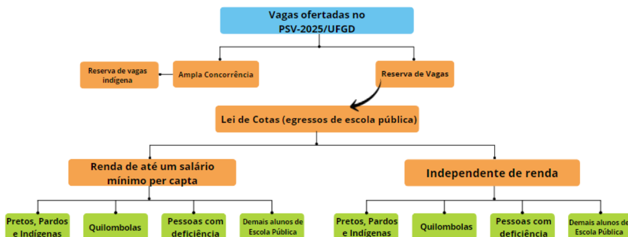
Diagrama 3 (Edital de Retificação CCS n.º 02/2024)

4.6. A distribuição das vagas ofertadas para os cursos de graduação presencial e para os cursos de graduação a distância em: Bacharelado em Letras Libras com habilitação em Tradutor/Intérprete em Libras; Licenciatura em Ciências Biológicas; Licenciatura em Educação Física e Tecnológico em Gestão de Recursos Humanos está explicitada no diagrama abaixo: