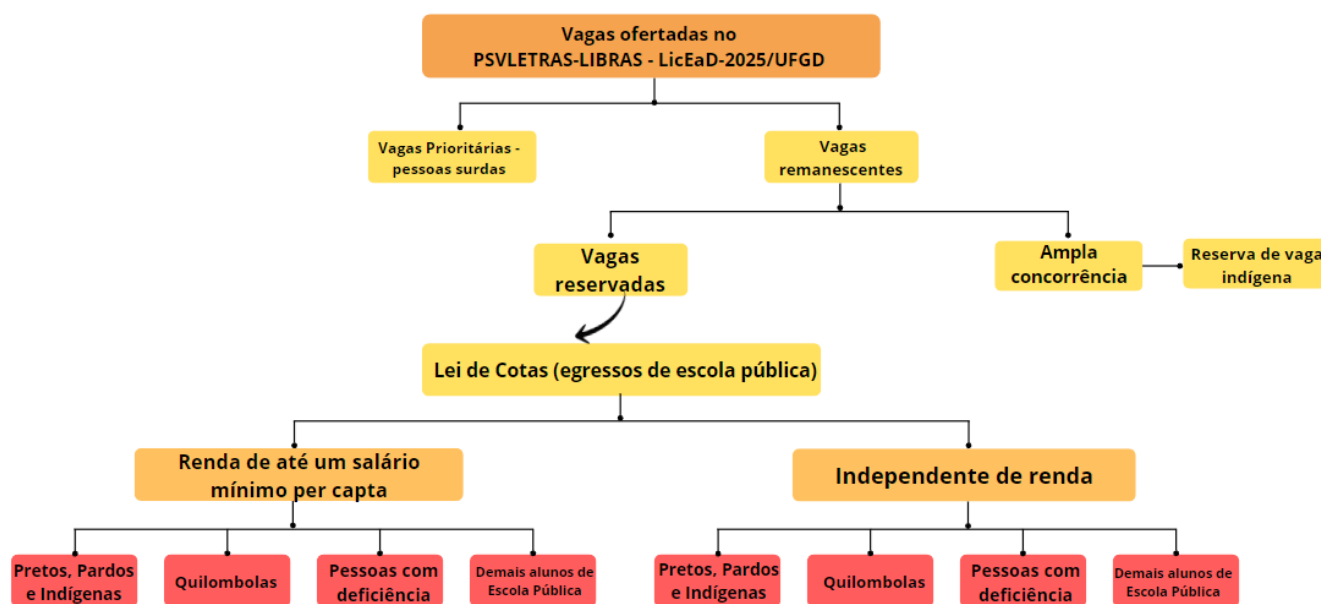
Diagrama 4 (Edital de Retificação CCS n.º 03/2024)

4.8. O candidato deverá escolher a faixa de renda per capita em que se enquadra, selecionar sua cor/raça, informar caso se enquadre, nos termos da lei, como PcD, e ainda indicar se é quilombola.